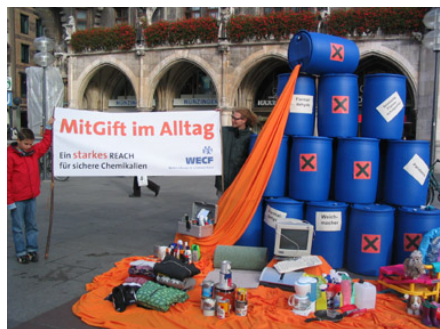
WECF organiseert een succesvolle actie in München.